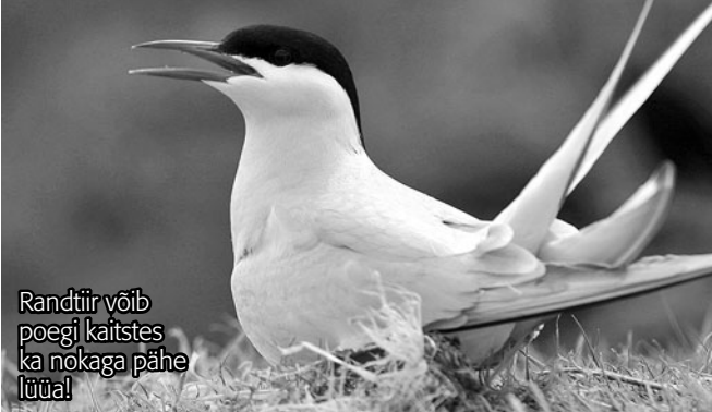
Randtiir võib poegi kaitstes ka nokaga pähe lüüa!