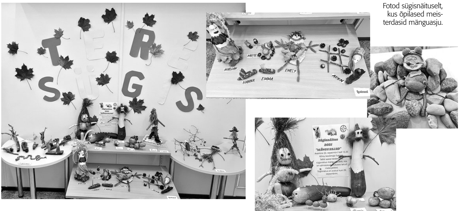
Fotod sügisnäituselt, kus õpilased meisterdasid mänguasju.