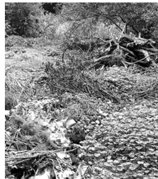
Aiajäätmetega satub loodusesse ka võõrliike.

Niisked puulehed ei sobi põletamiseks, sest ei põle täielikult ning tekitavad rohkelt suitsu. Mittetäieliku põlemise tõttu lendub sellisest lõkkest mürgiseid ühendeid, mis on tervisele