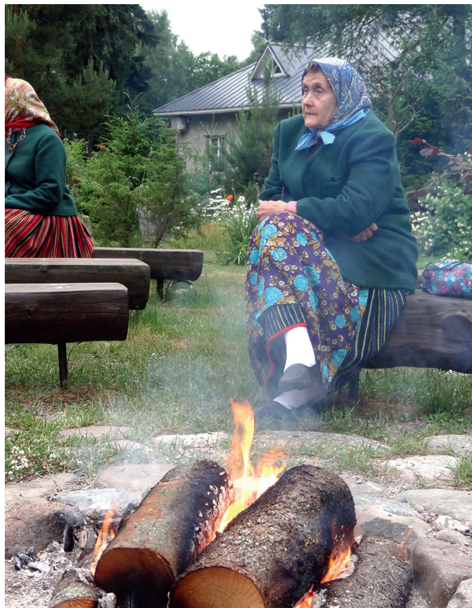
Foto jutuveestmisest Aegna saarel 2013. aastal.

Tähaks teada, kes oli see tark inimene, kes tuli mõttele Järsumäe perebänd teha. Ma teadsin, et Reena ja Raina on juba lapsest saadik muusikaalised ja perebänd tõi neile suure elumuutuse ja nüüd puhkesid kaunimad õied õitsemale. Koos oma pere bändiga sai ta esitada seda loomingut ja laule, mida oli kandnud terve elu.