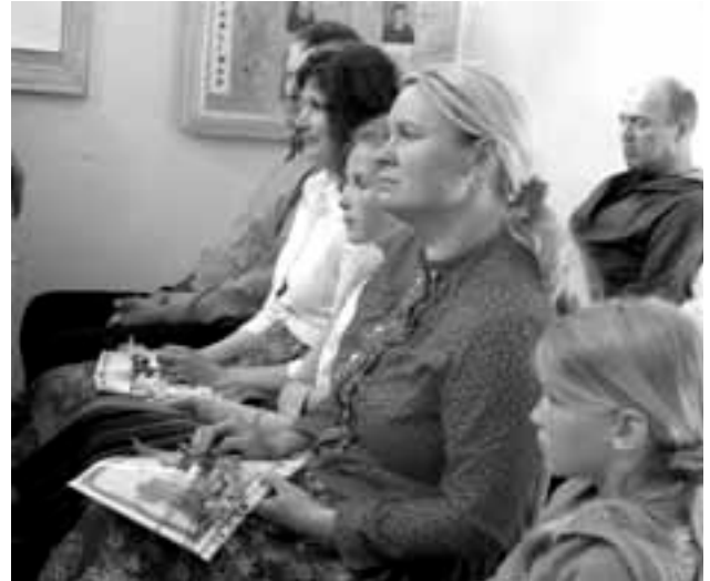
Viimase koolipäeva õhtul kutsus direktor tublid lapsed koos vanematega vastuvõtule, et tänukirju üle anda.

Kiituskirjaga klassi lõpetanud 2009.-2010. õppeaastal