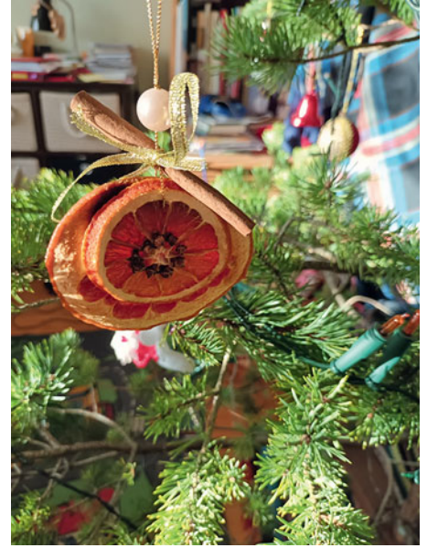
Eripreemia: Ehe ehe - Hille Umb