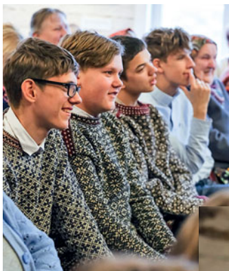
Poesid kirjavatõ troidõga naa kenädäd.