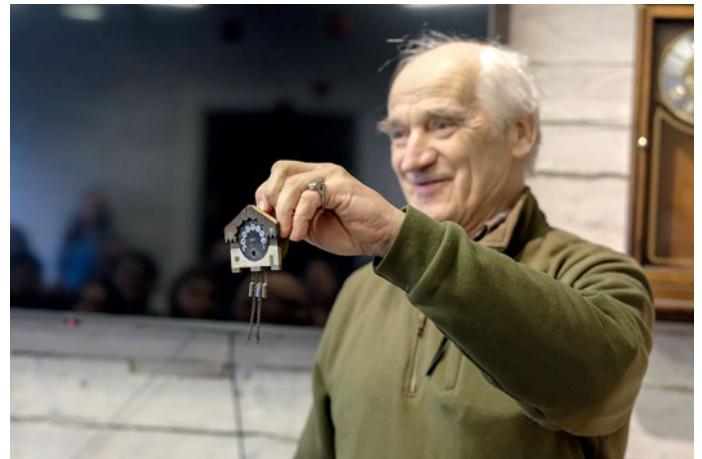
Uuda Toivo kellakogoss onnd aa-näütjäsi, mis käääd küll seenä, küll lava, küll käe piäle, sõrmusõna sõrmõ või uurina tasku.