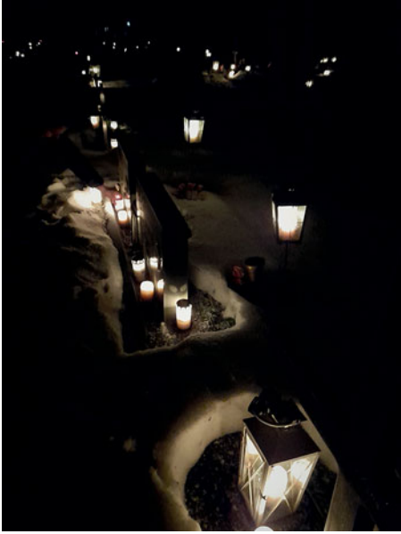
II koht - Eve Tapp