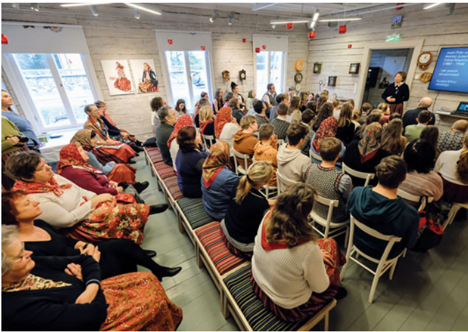
Küündläpae vabu kohti ei jäess.